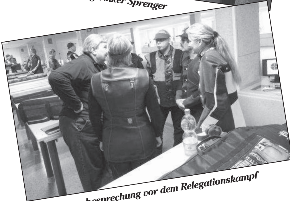
Teambesprechung vor dem Relegationskampf